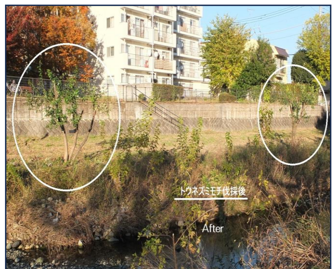
トウネズミモチ伐採 After