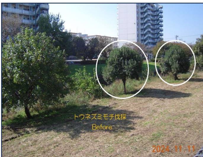
トウネズミモチ伐採 Before

外来種のトウネズミモチは、枝葉が密集しておる上に大量の果実房を付けているため、風当りを弱める必要があり、チェーンソーを使っての思い切った剪定を行った結果、スッキリした景観となり、来春行う鯉のぼりの掲揚もし易くなるメリットもありそうです。一方、切り枝葉は大量に発生したため、収集束ね作業はタフとなり予想以上に時間を要しました。