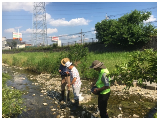
6月第一日曜日 水質調査 (上橋～大沼田橋)