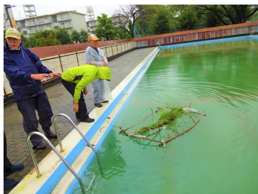
9月ヤゴ筏(ヤンマトンボの産卵用)