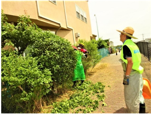
6月、8月、10月下堀公苑他のせん定・草刈り