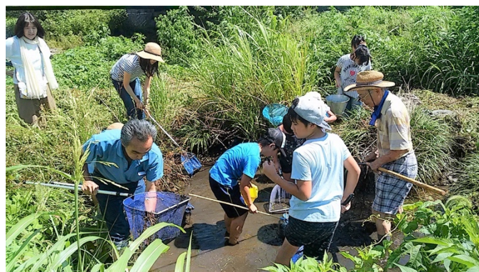
8月 御成橋ワンド 生き物調査 恩多町