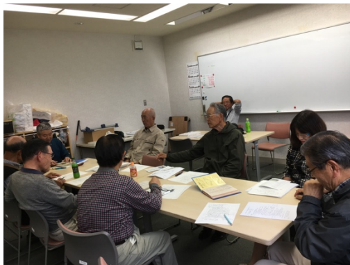
NPO 定例会(原則第2土曜日)地域福祉センター