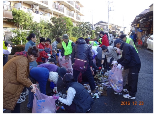
12月末まちかど清掃に参加