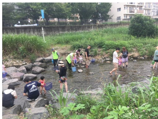
7月 ガサガサ(魚捕り) 美住町